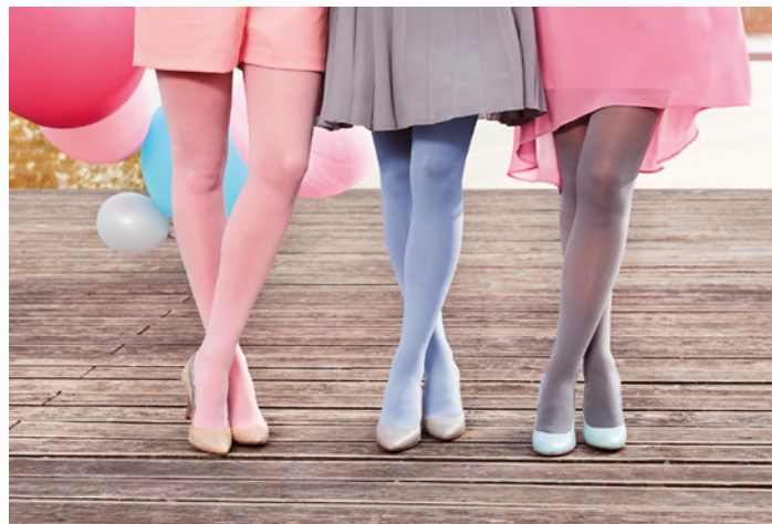
Regelmäßig warten neue Modehighlights auf Sie!

langfristige Betreuung: Termin alle 6 Monate