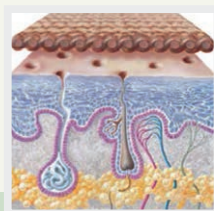
Durch Kompression abgeflachte Narbe