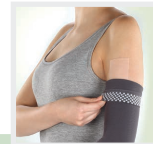
Silikonauflage für Kompressionsärmel